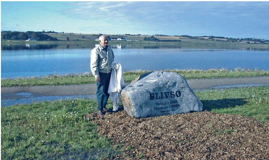
Lodsejerne med jord i den tidligere afvandede sø har rejst en mindesten med teksten "Slivsø – tørlagt 1958. Genskabt 2001. Tak for lån". I al stilfærdighed udtrykker denne tekst, at man lokalt har accepteret at give "det lånte" tilbage til naturen.